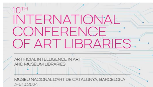
Figuras 1 y 2: Carteles anunciadores de los eventos