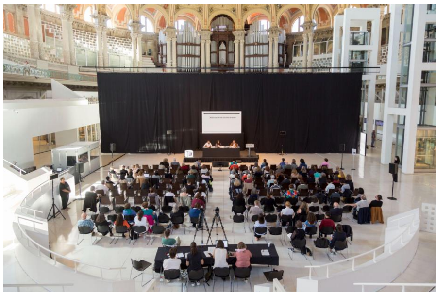
Figura 6: Asistentes a la 10ª Conferencia Internacional de Bibliotecas de Arte.

Los temas principales tratados han girado en torno al panorama de las bibliotecas de arte y museos en España y a la inteligencia artificial. El encuentro ha servido para conocer el panorama de las bibliotecas de arte y museos españoles, sus estructuras, estrategias y proyectos y explorar las posibilidades de integración con la red artdiscovery.net .