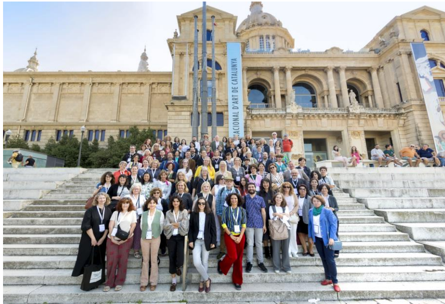
Figura 7: Participantes del 10º Congreso Internacional de Bibliotecas de Arte.

Respecto a los desafíos que la IA presenta en nuestro sector, destacan aquellos relacionados con la transformación digital, especialmente en los aspectos técnicos y éticos; la preservación de contenidos digitales, y las ventajas y limitaciones del aprendizaje automático. Este panorama requiere soluciones innovadoras que aseguren tanto la eficiencia en la gestión de datos como la sostenibilidad a largo plazo de los recursos culturales.