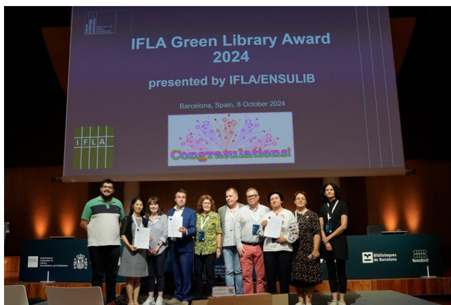
Figura 5. Entrega de premios a la Mejor Biblioteca / Proyecto Verde.

También se ha ocupado, como hemos comentado anteriormente, de organizar la entrega del premio a la Mejor Biblioteca Verde y al Mejor Proyecto Verde.