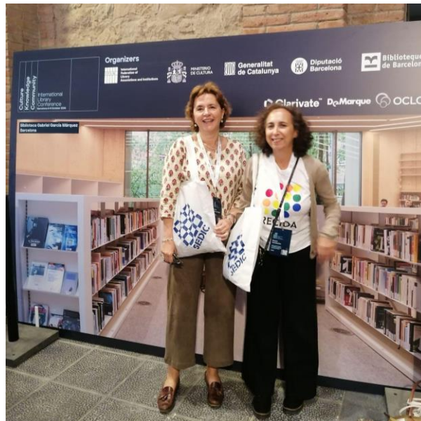
Figura 8: Autoras del artículo en los Encuentros Internacionales.

El evento concluyó con reflexiones inspiradoras sobre el futuro de las bibliotecas de arte, destacando la relevancia de la colaboración internacional y la adopción de tecnologías avanzadas para optimizar el acceso y la conservación del patrimonio cultural.