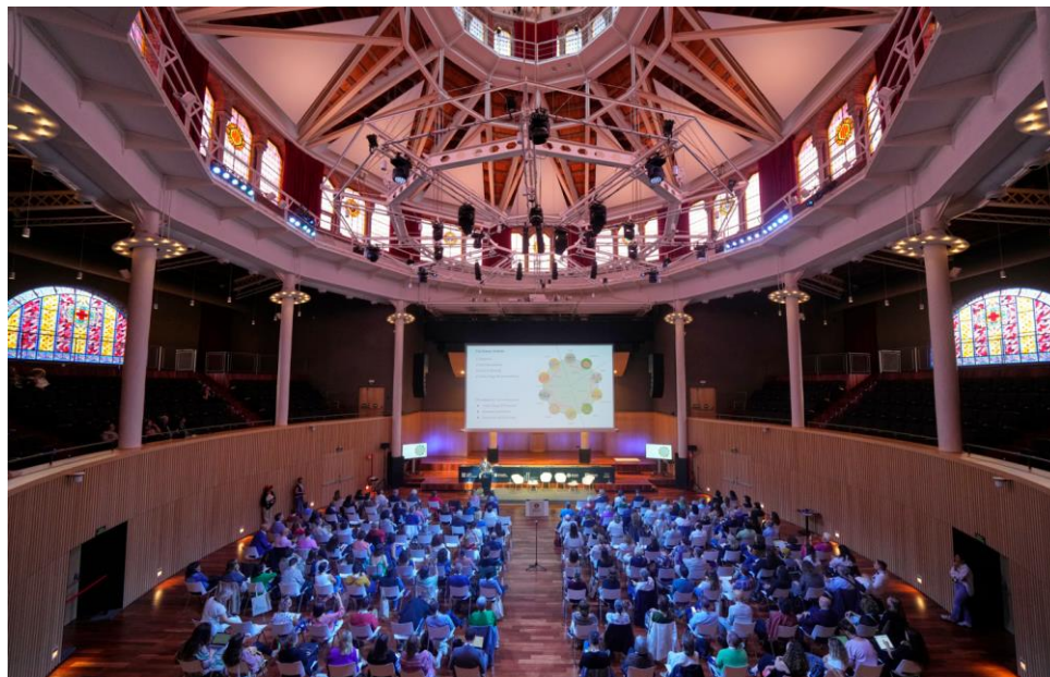
Figura 3: Paraninfo de la Escuela Industrial de Barcelona. © Alejandro García

En la mesa sobre la democracia se ha debatido cómo las bibliotecas generan participación ciudadana y abordan asuntos conflictivos o controvertidos. Se ha hecho hincapié en que se debe argumentar mejor a los políticos la labor que se realiza y así visualizar más el trabajo y poder avanzar.